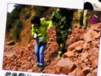
然後爬山。(前面爬的時候根本不敢拍照片)