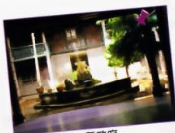
木制舊宅院=縣政府

下鄉之前，我們在喜德縣政府開過一個會。這裏是昔日土司的宅院，是木制的，很有韻味，但在裏面開會實在有些冷。縣裏項目辦人員提了很多想法，大致是所有涉及村同時進行相同項目。